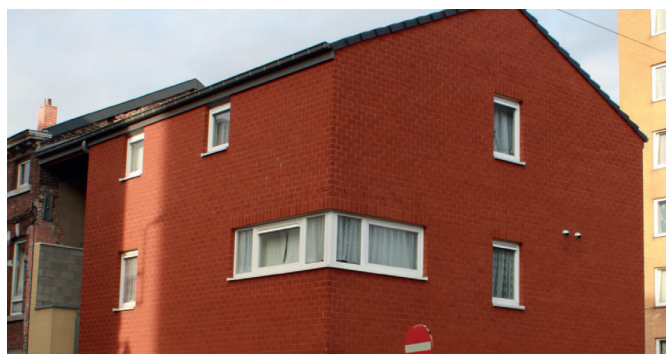
Rue des Porteuses d'Eau

Après ces différents chantiers, les rues des Porteuses d'Eau, Cour du Rivage et de Porto 2 ainsi que les immeubles situés rue du Marché ont subi de grosses rénovations au niveau de l'électricité, des sanitaires et des châssis.