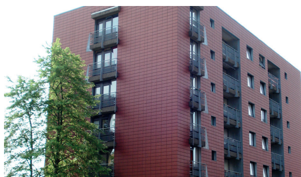
Rue Jules Boursier

Tous les immeubles de plus de 4 étages sont munis d'ascenseurs afin de desservir tous les étages.