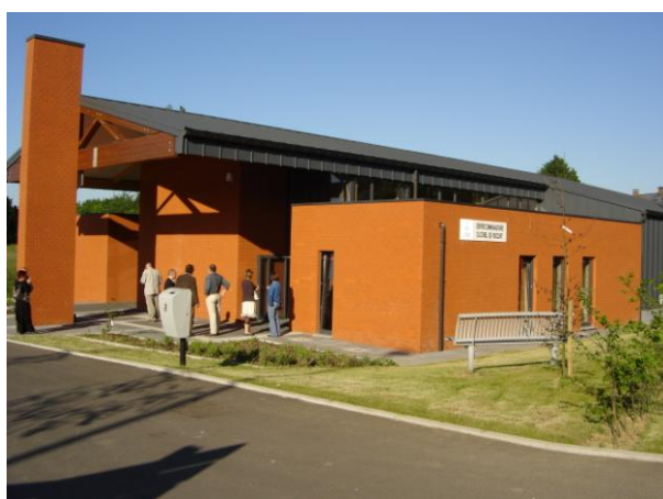
Centre communautaire de Rocourt