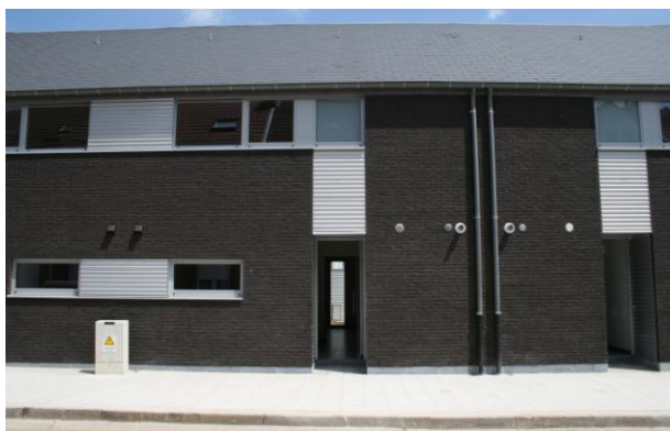
Rue Hubert Coune

Dans le dernier trimestre 2008, nous avons eu l'ambition folle, avec un bail emphytéotique de la Ville et un subventionnement via un article 54 du code Wallon du logement, de créer des logements dans une ancienne école désaffectée de la rue Hubert Coune. Pour un montant avoisinant 1.900.000 €, nous avons créé 8 maisons à rue et 8 appartements dans la cour de cette école. Ces logements récents bénéficient de tout le confort moderne ainsi que des équipements permettant de faire des économies d'énergie par exemple, ils sont chacun muni d'un groupe hydrophore afin de récupérer l'eau de pluie pour un usage domestique. De plus, l'aménagement de la cour intérieure permet des moments conviviaux entre voisins.