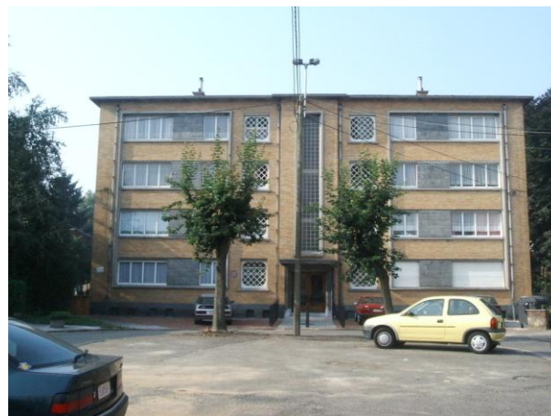
Rue Joseph Donneaux

Nous nous sommes ensuite attaqués à la Cité du Moulin et rue du Moulin-à-Vent qui représentent les principaux logements que nous possédons à Glain. Cette rénovation de plus de 3.000.000 € fut longue et tumultueuse. L'entreprise initiale en charge des travaux de gros œuvres ayant fait faillite en cours de chantier, celui-ci a été mis à l'arrêt pendant de longs mois dans l'attente de la désignation d'un nouvel adjudicataire. Ce chantier de 168 logements a donc duré plus de 3 ans afin de placer des chaudières individuelles avec un radiateur par logement, mettre aux normes l'électricité, renouveler les toitures, et rénover totalement les sanitaires.