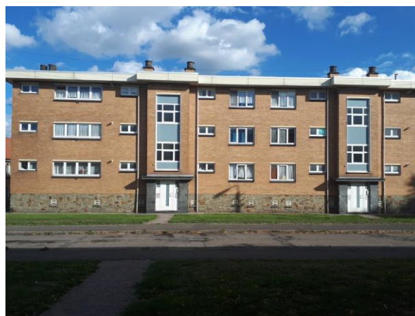
Cité du Moulin