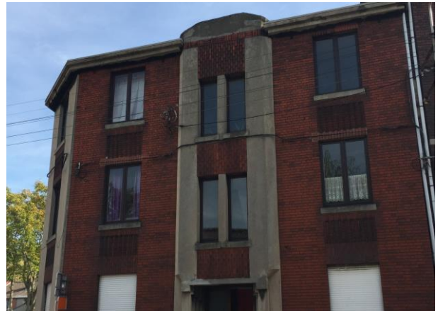
Rue de Trazegnies

Nous disposons également de 38 garages individuels dont 17 sont situés Résidence Fraternité et 21 se trouvent dans la rue de l'Hippodrome.