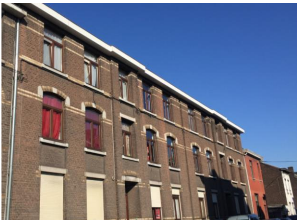
Rue Gilles Galler

Entre 2012 et 2013, ce sont les 21 appartements des rues Gilles Galler et du Vieux Château qui ont fait l'objet d'une mise en conformité électrique, d'une sécurisation incendie ainsi que d'une rénovation des toitures. Coût de l'opération : 265.000 €.