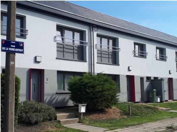
Rue de la Veine-Sothuy

Le coût de ce chantier, non négligeable, puisqu'il s'élève à 1.500.000 €, permettra à nos locataires de réduire leur facture énergétique.