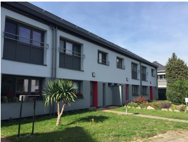
Rue de la Veine-Sothuy

Nous disposons également de 38 garages individuels dont 17 sont situés Résidence Fraternité et 21 se trouvent dans la rue de l'Hippodrome.