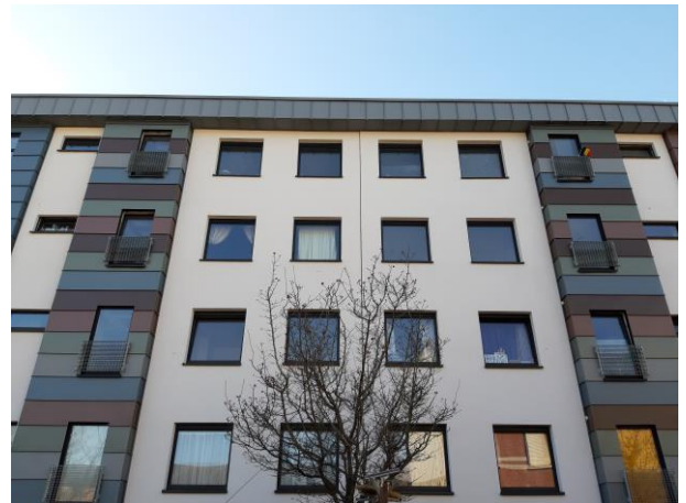
Rue Désiré Simonis