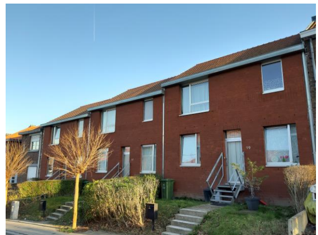
Rue Armand Michaux

En 2007, nous avons déconstruit 11 maisons de la rue Armand Michaux qui étaient trop vétustes pour être rénovées et nous y avons construit 6 maisons assez atypiques vu la configuration du terrain.