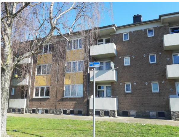
Cité André Renard

Ainsi, en 2005, nos logements situés Cité André Renard, Place Gilles Etienne, rues Jacques Lemaire, Vivi Potale et de la Chapelle ont bénéficié d'une rénovation électrique et sanitaire, de la pose de portes coupe-feu et de l'installation du chauffage central.