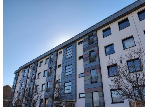
Rue Désiré Simonis

Nous disposons également de 87 garages individuels situés rues des Trixhes, des Godets, Armand Michaux, de la Libération, de Visé et Cité André Renard.