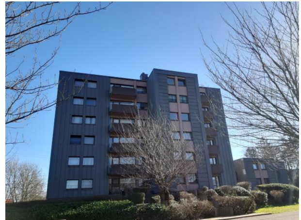
Rue des Canoniers

Entre 2005 et 2008, la cité de la rue des Canoniers étant déjà équipée de chauffage central et de double vitrage, nous avons enveloppé les bâtiments avec un bardage sur isolant, fait poser une nouvelle toiture et avons réalisé une mise en conformité aux normes de sécurité incendie. En 2012, de nouvelles chaudières ont pu être installées ainsi que des vannes thermostatiques.