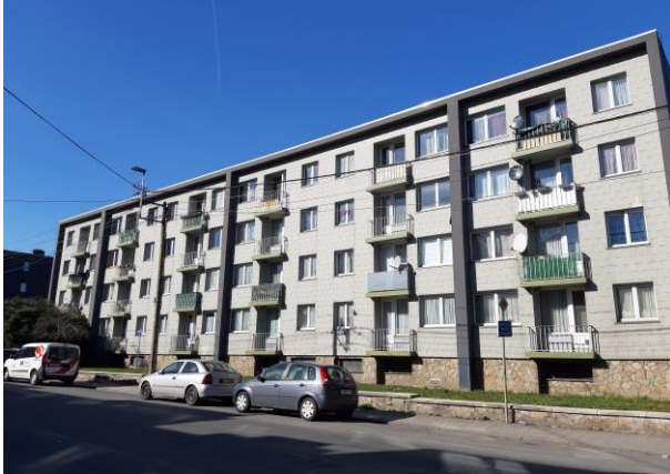
Rue de Visé

La rue de Visé à quant à elle subi une rénovation électrique en 2012.