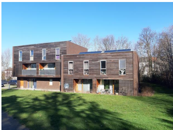
Rue des Canoniers 43-45

En 2014, 5 logements semi passifs ont pu être construits rue des Canoniers. Grâce à une isolation performante et à des équipements tels que des panneaux solaires thermiques, l'empreinte écologique du bâtiment et donc de ses occupants est moins importante.